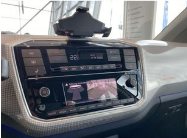
Fischer-Schädler 06101 - 5267 0 verkauf@fischer-schaedler.de Das WeltAuto. Zertifizierte Gebrauchtwagen