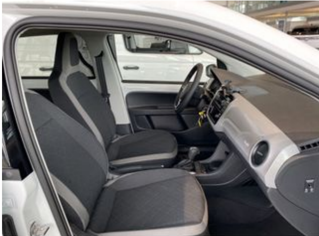
Fischer-Schädler 06101 - 5267 0 verkauf@fischer-schaedler.de Das WeltAuto. Zertifizierte Gebrauchtwagen