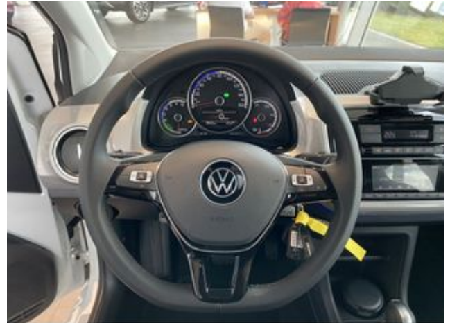
Fischer-Schädler 06101 - 5267 0 verkauf@fischer-schaedler.de Das WeltAuto. Zertifizierte Gebrauchtwagen