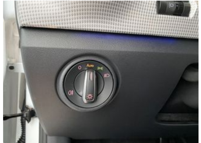
Fischer-Schädler 06101 - 5267 0 verkauf@fischer-schaedler.de Das WeltAuto. Zertifizierte Gebrauchtwagen