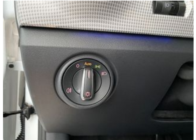
Fischer-Schädler 06101 - 5267 0 verkauf@fischer-schaedler.de Das WeltAuto. Zertifizierte Gebrauchtwagen