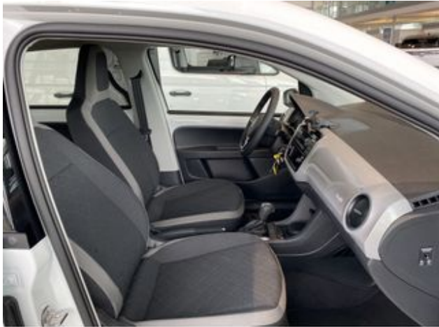
Fischer-Schädler 06101 - 5267 0 verkauf@fischer-schaedler.de Das WeltAuto. Zertifizierte Gebrauchtwagen