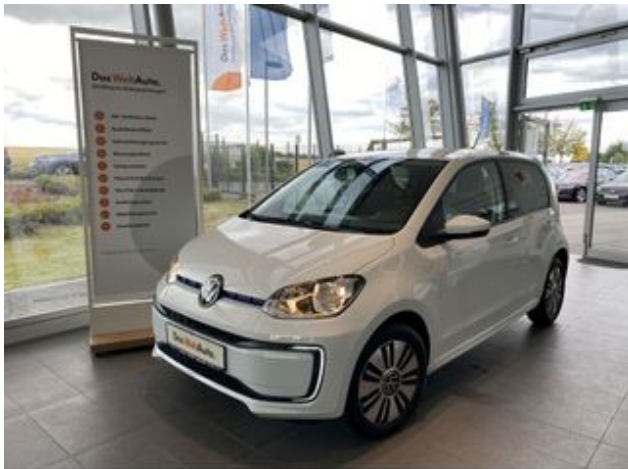
Fischer-Schädler 06101 - 5267 0 verkauf@fischer-schaedler.de Das WeltAuto. Zertifizierte Gebrauchtwagen