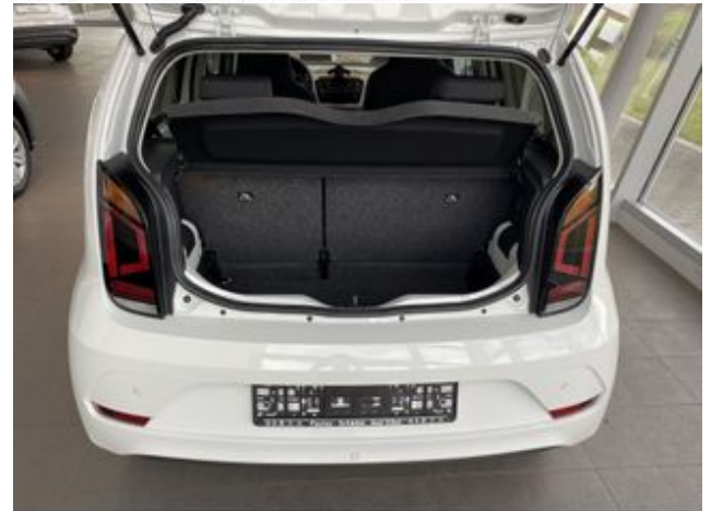
Fischer-Schädler 06101 - 5267 0 verkauf@fischer-schaedler.de Das WeltAuto. Zertifizierte Gebrauchtwagen