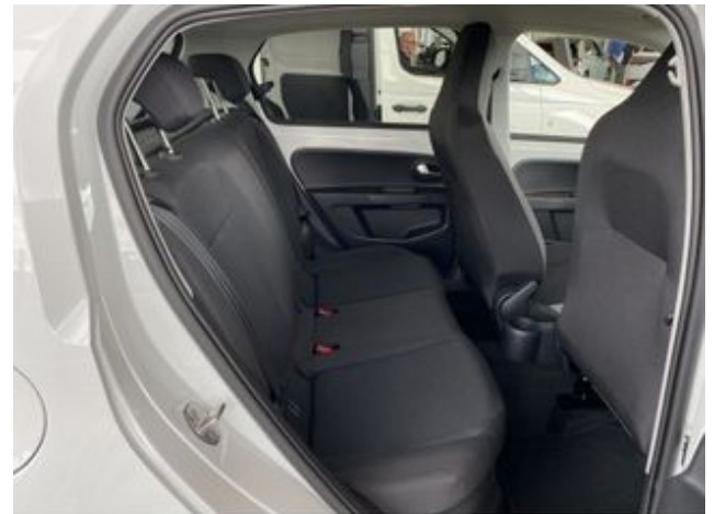
Fischer-Schädler 06101 - 5267 0 verkauf@fischer-schaedler.de Das WeltAuto. Zertifizierte Gebrauchtwagen