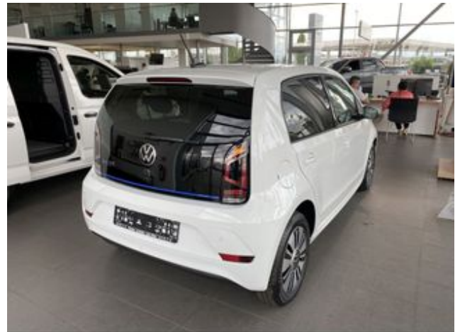
Fischer-Schädler 06101 - 5267 0 verkauf@fischer-schaedler.de Das WeltAuto. Zertifizierte Gebrauchtwagen