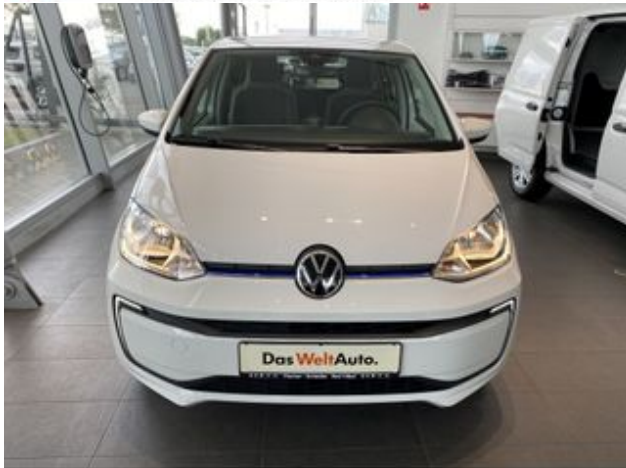
Fischer-Schädler 06101 - 5267 0 verkauf@fischer-schaedler.de Das WeltAuto. Zertifizierte Gebrauchtwagen