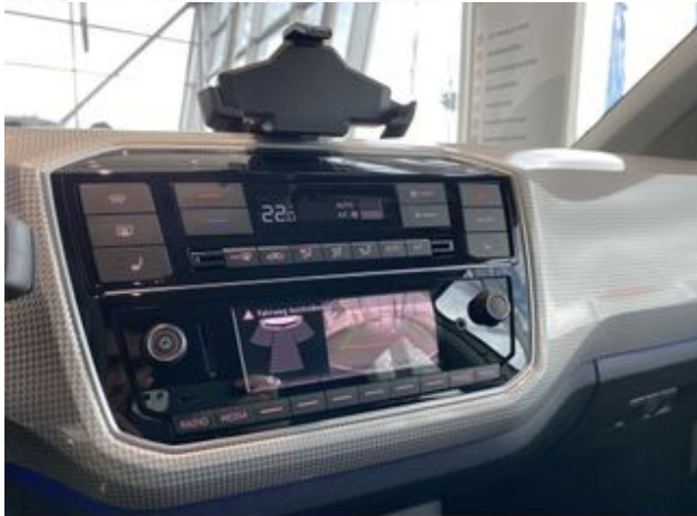
Fischer-Schädler 06101 - 5267 0 verkauf@fischer-schaedler.de Das WeltAuto. Zertifizierte Gebrauchtwagen