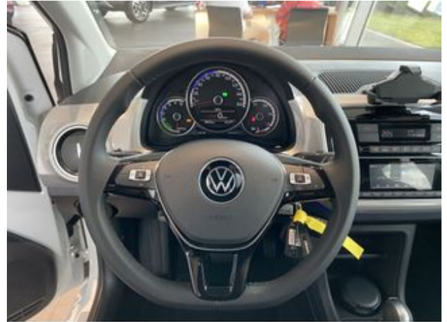
Fischer-Schädler 06101 - 5267 0 verkauf@fischer-schaedler.de Das WeltAuto. Zertifizierte Gebrauchtwagen