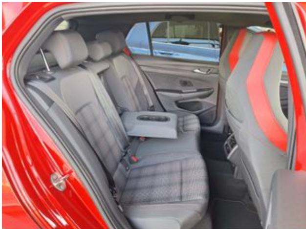
Fischer-Schädler 06101 - 5267 0 Zertifizierte Gebrauchtwagen verkauf@fischer-schaedler.de