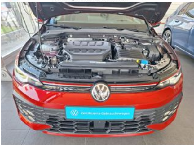
Fischer-Schädler 06101 - 5267 0 Zertifizierte Gebrauchtwagen verkauf@fischer-schaedler.de