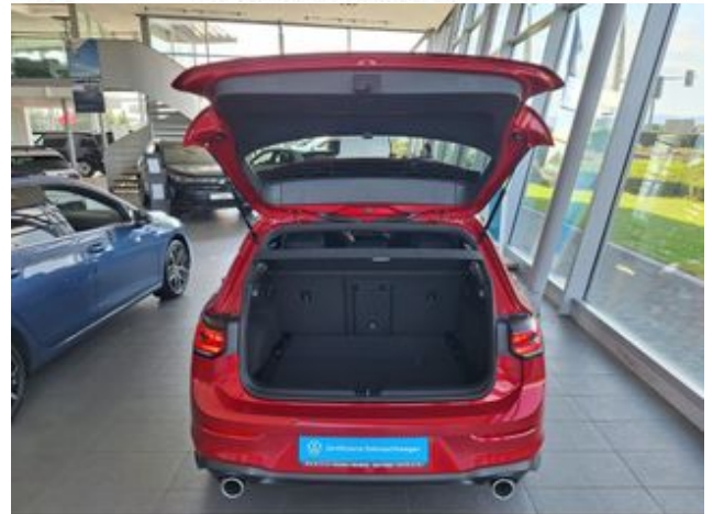
Fischer-Schädler 06101 - 5267 0 Zertifizierte Gebrauchtwagen verkauf@fischer-schaedler.de